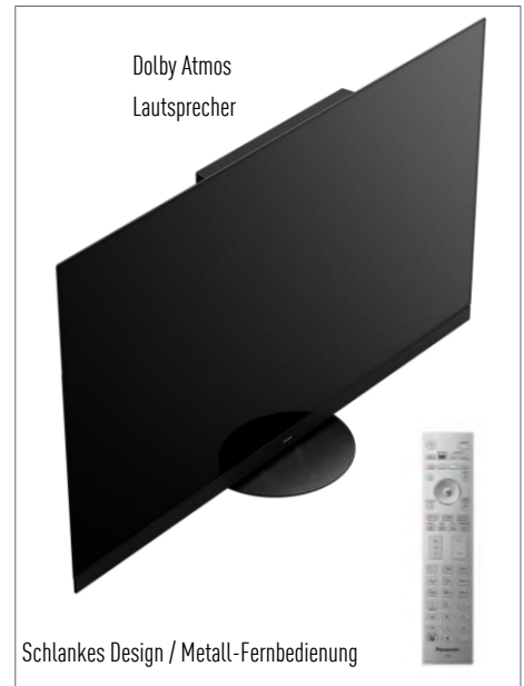
Dolby Atmos Lautsprecher

Neue Möglichkeiten des Fernsehens – Unterstützung von TV>IP, zahlreicher Apps und des HbbTV Operator App Standards