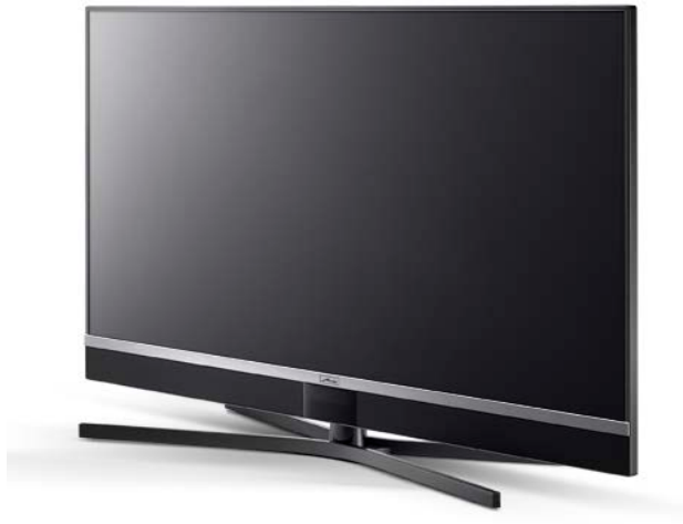
Schwarz mit Zierblende aus gebürstetem Aluminium / Aluminium-Rahmen